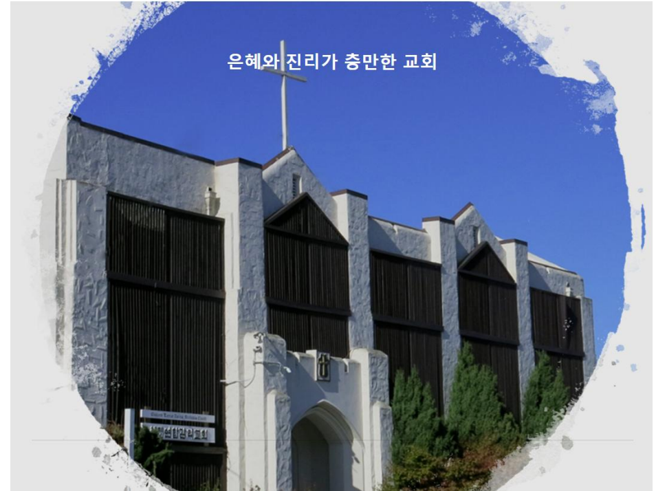
은혜와 진리가 충만한 교회